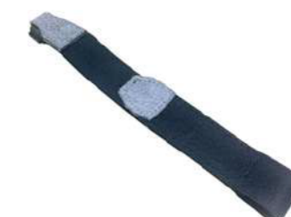
Ремешок на руку