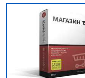
Бесплатная лицензия до 1 сентября 2022 г.