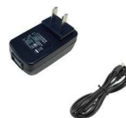
Адаптер питания и USB-кабель