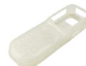
Защитный силиконовый чехол